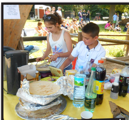
La buvette pour petits et grands