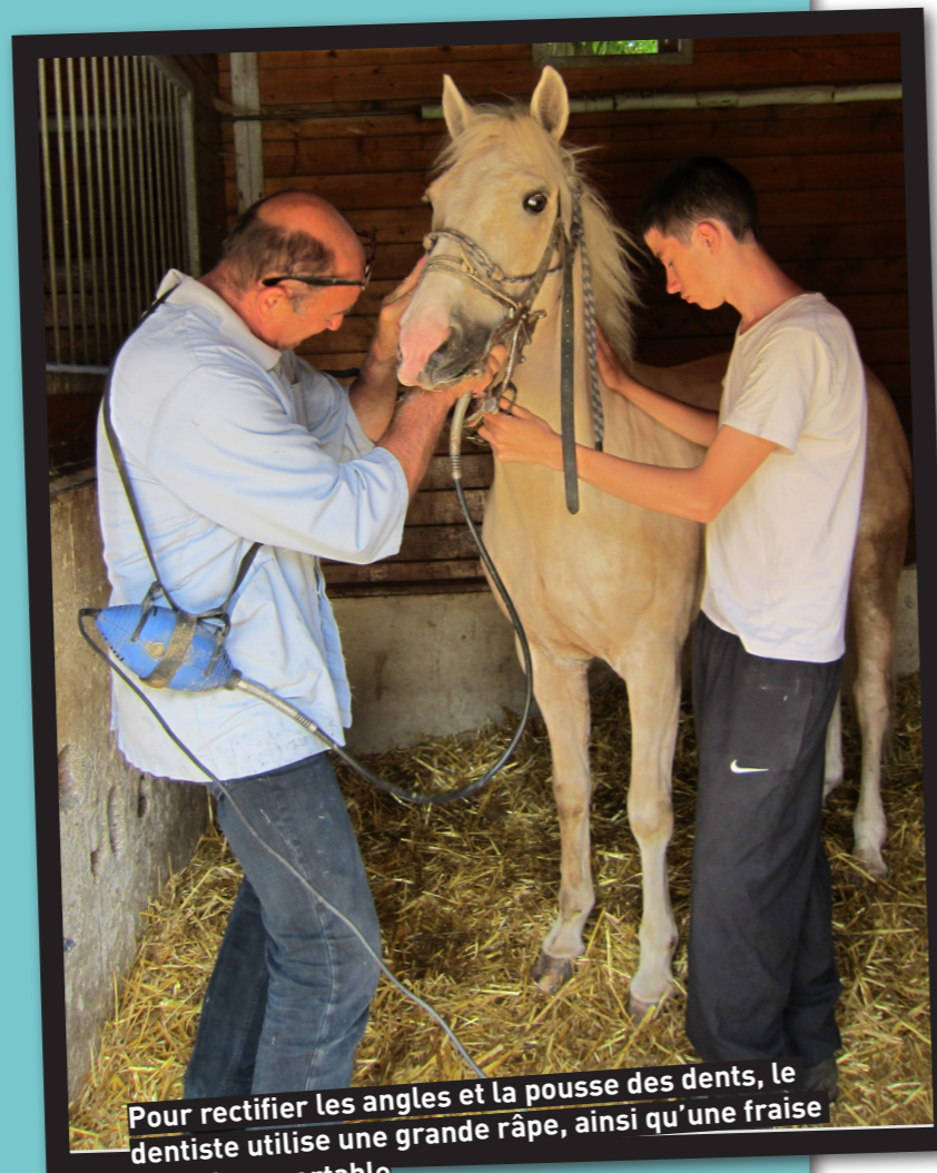
Pour rectifier les angles et la pousse des dents, le dentiste utilise une grande râpe, ainsi qu'une fraise électrique portable