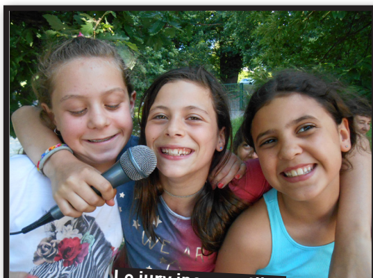
Le jury incorruptible