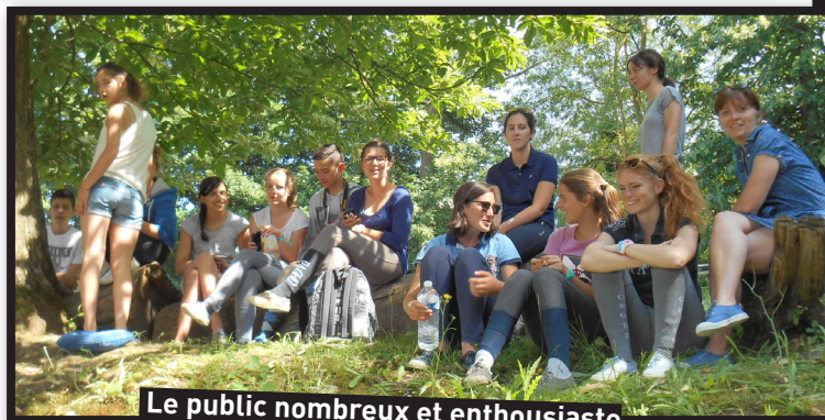
Le public nombreux et enthousiaste