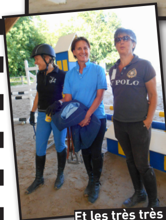
Et les très très grands !