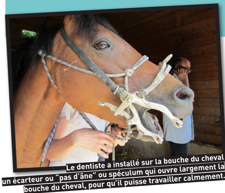
Le dentiste a installé sur la bouche du cheval un écarteur ou "pas d'âne" ou spéculum qui ouvre largement la bouche du cheval, pour qu'il puisse travailler calmement.