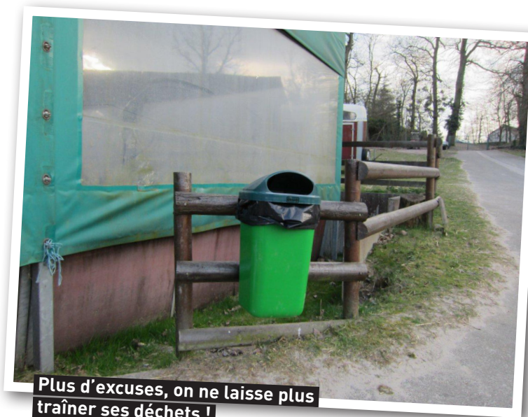
Plus d'excuses, on ne laisse plus traîner ses déchets !

Après trois heures d'efforts et l'ensemble des travaux réalisés, un bon goûter a permis à tous de retrouver des forces.